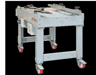
Halbautomatische Kartonverklebemaschinen in verschiedenen Maschinenausführungen